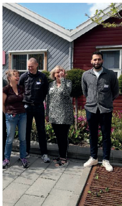
På billedet står de nyuddannede demensven-instruktører.

Uddannelsen er en del af Projekt Rummelighed, som Alzheimerforeningen står bag. Ideen er at gøre de almennyttige boligområder mere demensvenlige.