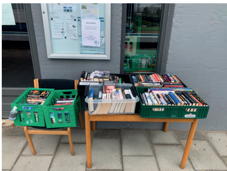
Billedet er fra Hedegaven, hvor der er godt gang i læsningen af de mange gratisbøger.

Vi flytter jo vores ta-selv bogbord lidt ind og ud – alt efter vejret. Jeg kunne godt tænke mig nogle bogskabe, der stod permanent rundt omkring i gårdene.