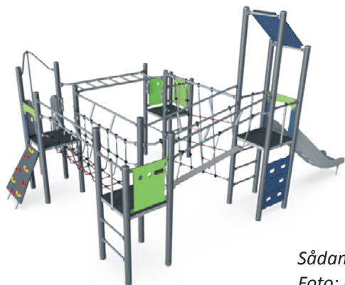
Sådan ser det nye legetårn ud. Det bliver opsat i midten af april.

Jo længere tid børn leger, jo flere nye lege finder de på. Det kan være ”jorden er giftig”, der giver børn mulighed for at udvikle sine fysiske kompetencer og sociale færdigheder