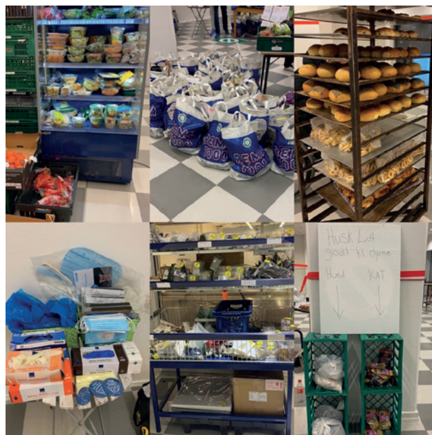
På billedet kan du se et udvalg af de mange ting, som butikkerne donerede lillejuleaften.

”Vi har været i dialog med kommunen, men de har desværre ikke kunnet hjælpe os med et sted, hvor vi kunne være. Det er ærgerligt. Nu må vi tænke noget andet,” lyder det fra formanden, der håber på en privat samarbejdspartner.