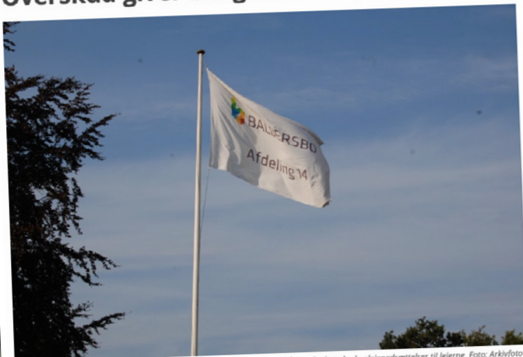
Baldersbo har landet et stort overskud i 2020, på trods af et udfordrende år og det betyder huslejenedsættelser til lejerne.

HUSLEJE Boligselskabet Baldersbo har i 2020 fokuseret på effektivisering af driften og det har skabt et stort millionoverskud, der nu igen kommer lejerne til gode.