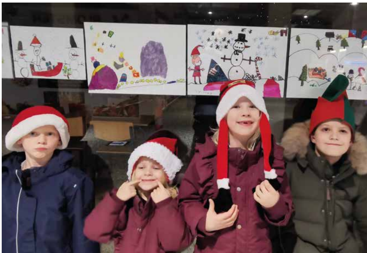
På billedet er de kreative børn. De står under den tegning, de har lavet. Nu glæder de sig til at skulle i biffen.

Familien vandt både biografbilletter og slik – og glæder sig nu til, at biografene åbner igen.