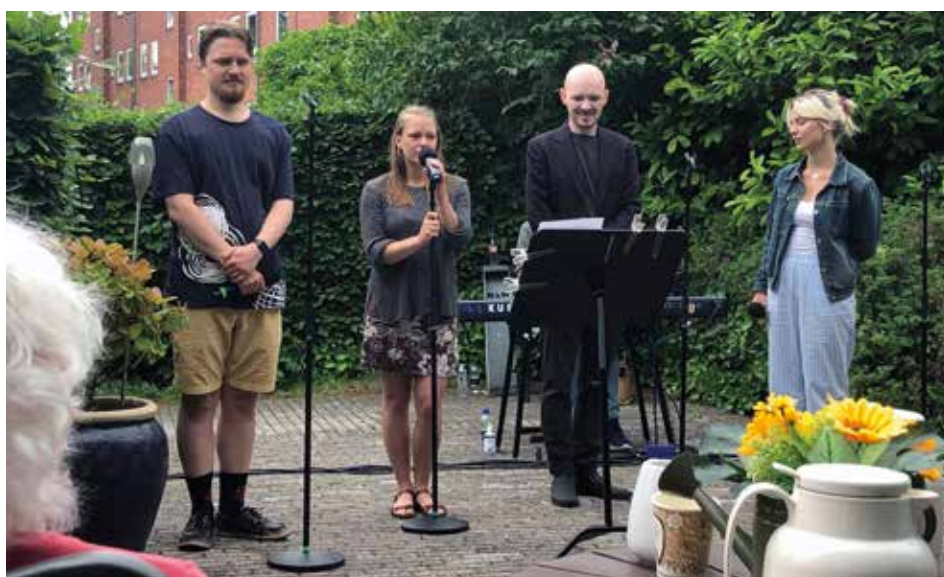
Billedet er fra lørdagens koncert, hvor der var sange nok at synge med på for beboerne.

Efter koncerten var der frokost for alle beboerne. Plejecenter Lindehaven ejes af Baldersbo og drives af Ballerup Kommune.