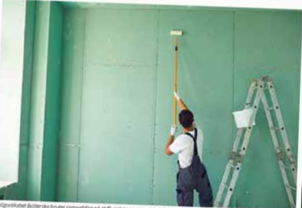
Boligselskabet Baldersbo bruger coronavirusen på at få mest ud af, skifter års og renoverer væggesnit i Byggestien.