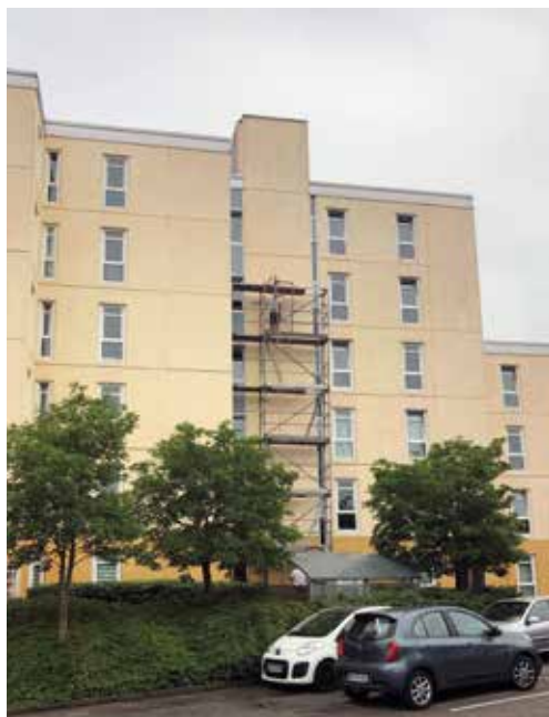
Et stillads i 6. sals højde ved at tage form i Eskebjerggård.

Det omfattende arbejde kommer ikke til at koste huslejestigninger. Pengene til arbejdet har Eskebjerggård nemlig sparet op. Eskebjerggård består af 421 boliger og er opført i 1974.