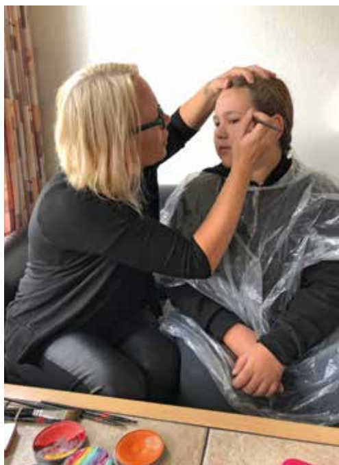
Billedet er fra sommerfesten sidste år, hvor Æsken bl.a. var stedet, hvor børnene kunne blive ansigtsmalet.