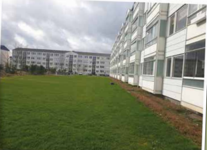
For mange af beboerne i Baldersbos afdelinger vil det blive lidt billigere at betale huslejen det kommende år. Men der er også nogen, der får en lille stigning.