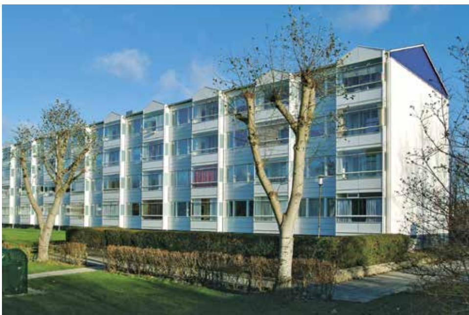
Legepladsulykken skete her ved bebyggelsen på Baltorpevej, hvor flere af beboerne var vidner til det tragiske dødsfald.

På baggrund af den tragiske sag gik Ballerup Kommune også i gang med at gennemgå alle deres legepladser, både på institutioner og 'i det fri', for at sikre, at der ikke kan ske noget lignende igen.