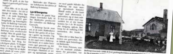
Baldersbo i 1918. De blev grundlagt af søstervænen og plejehjemmet Søstervænen. Søstervænen har bygget i mange år. Nu er grundene solgt og der skal bygges en ny afdeling i Baldersbo. Søstervænen på Plæntovvej har købt den gamle bopæl på Plæntovvej og plejehjemmet Søstervænen.

Det gamle bopæl på Plæntovvej er nu et museum og plejehjem. Søstervænen Sørensen fortæller om en masse lokalhistorie, som byggerne i Baldersbo nu fortæller via YouTube.