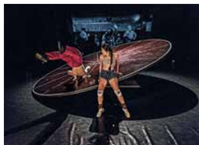
Billedet er fra forestillingen, der spiller den 8. november, hvor en stordrejescene er i fokus.