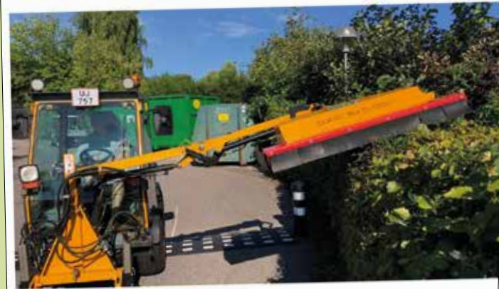
Baldersbo har købt et flak, så flere græspladser kan vedligeholdes hurtigere.