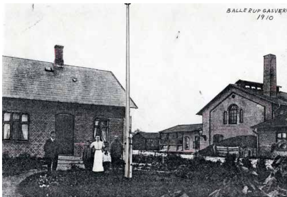
Billedet er fra Ballerup Gasværk i 1910.