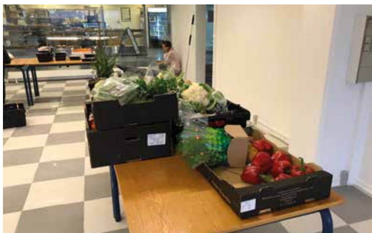
Billedet er maduddelingen lillejuleaften. Kasser med grøntsager, brød og kød blev uddelt fra den tidligere køkkenbutik.