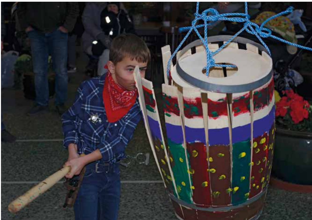
Billedet her er fra sidste års fastelavnsfest i Hede-Magleparken, hvor denne seje cowboy er ved at tage livet af den flotte tønde.