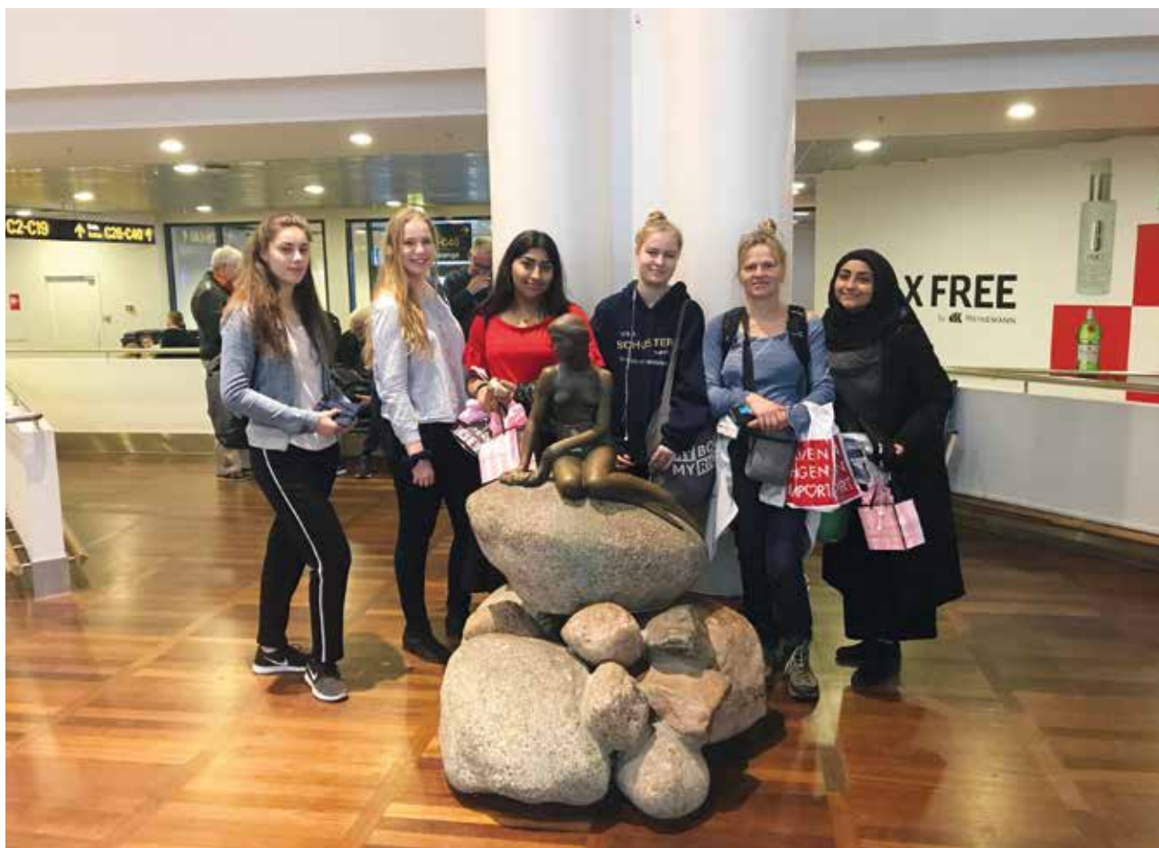
På billedet kan du se team Hede- Magleparken på vej ud til flyveren lørdag morgen.

Hele turen er betalt af EU programmet Erasmus.