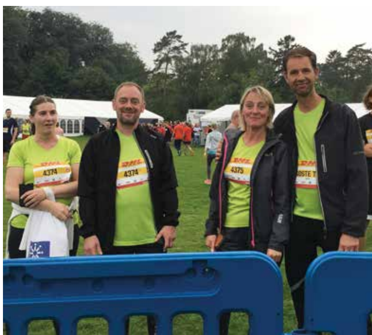
På billedet kan du se nogle af deltagerne fra Hede- Magleparkens hold ved DHL-stafetten.

Har du fået lyst til at løbe med holdet, så er du velkommen ved Hedegaven hver torsdag kl. 17.