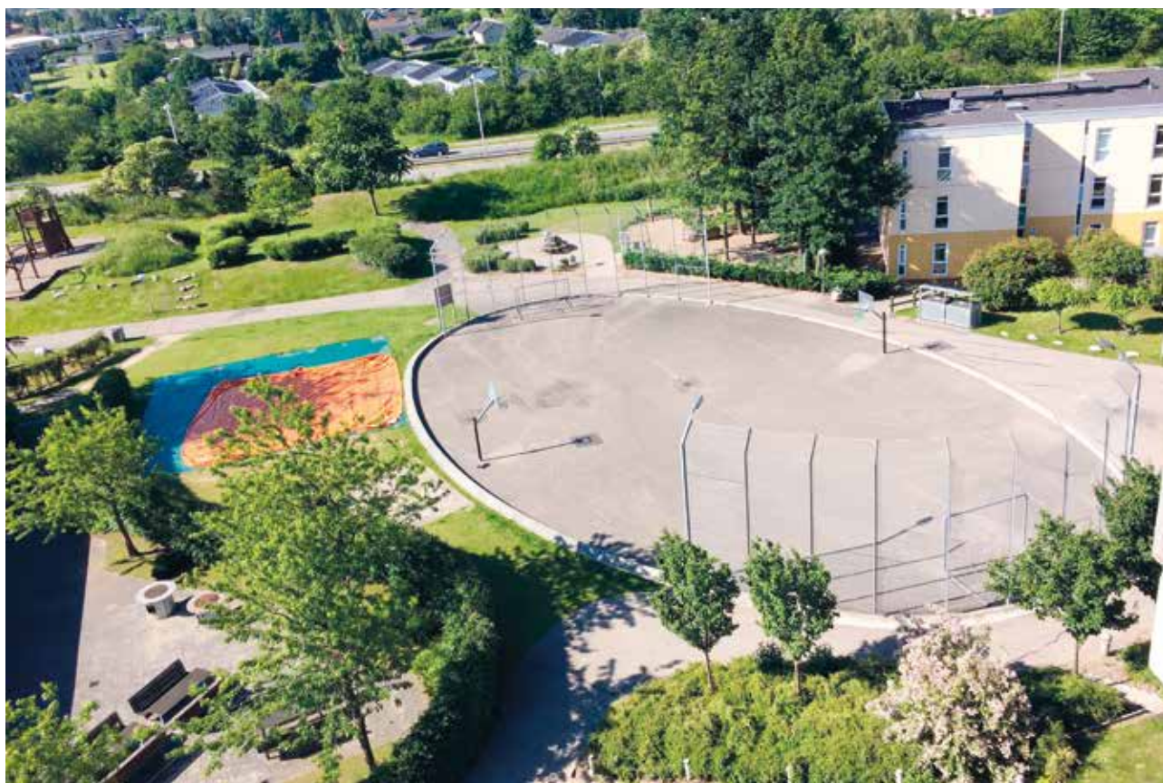
På billedet er den runde boldbane. Rundt om banen er der nu opstillet fire kraftige lys-armaturer, der skal forlænge udendørs aktiviteterne i afdeling 14. Lamperne er placeret ved enderne i det høje metal hegn.